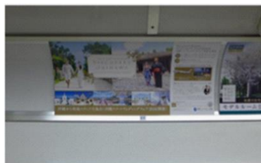
メトロ千代田線まで上(1/6~1/19)

【Discovery Okinawaプレミアムウェディングフォト発表記念 沖縄リゾートウェディングフェア in東京2016】