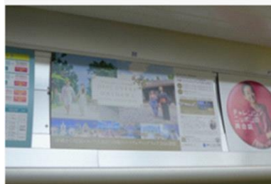
メトロ有楽町・副都心線まで上(1/6~1/19)