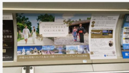
メトロ東西線まで上(1/6~1/19)