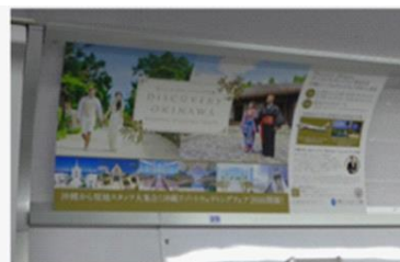
メトロ半蔵門線まで上(1/6~1/19)